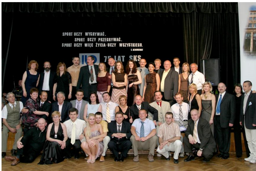
Uczestnicy Balu Sportowca

Zamierzeniem organizatorów były nie tylko obchody 75 lecia SKS. Jubileusz był okazją do podjęcia działań zmierzających do poprawy bazy sportowej Szkoły. Dzięki znacznemu wkładowi sponsorów wyremontowana została i wyposażona w nowy sprzęt tzw. mała sala gimnastyczna. W planie jest remont elewacji i uporządkowanie obejścia tego zabytkowego budynku. Uprzątnięte zostały tereny za salą, gdzie urządzone zostanie boisko do piłki siatkowej oraz skocznia w dal. W planie jest też doposażenie siłowni.